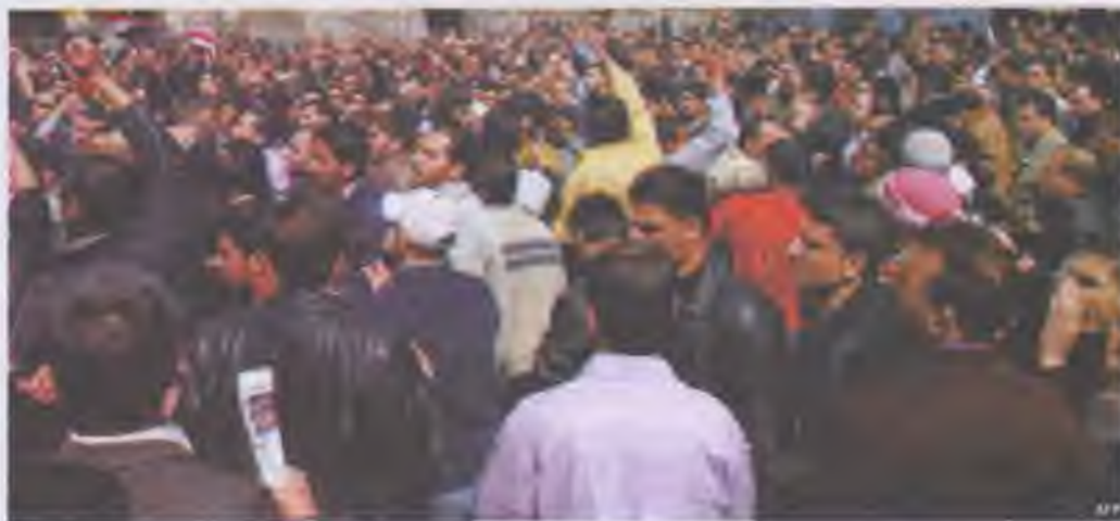
Антиурядова демонстрація в Львіві

Термін «бойкот» походить від прізвища Чарльза Канінгема Бойкота, британського управлінця в Ірландії, землі якого відмовились обробляти місцеві жителі. Одним з найвідоміших прикладів використання тактики бойкоту стала відмова населення африканського походження міста Монтгомері (штат Алабама, США) від використання міського транспорту в 1955 р. Таким чином мешканці висловили свій протест проти расової сегрегації.