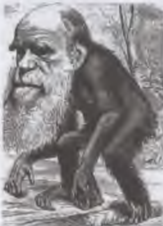
Карикатура на Ч. Дарвіна в сатиричному журналі «Шершень», XIX ст.

Еволюційна теорія найпоширеніша в сучасному науковому світі. Згідно з цією теорією людина виникла від вищих приматів — людиноподібних істот — шляхом поступових змін, під впливом природних чинників та природного відбору. На користь цієї теорії свідчать різноманітні палеонтологічні, археологічні, біологічні та інші докази. Засновником еволюційної теорії в біології вважають Чарлза Дарвіна, який висунув ідею про те, що всі живі організми еволюціонують в часі від спільних пращурів. Застосувавши цю теорію щодо походження людини, вчені дійшли висновку, що люди походять від мавпоподібних предків. Доказом цьому слугує один з фактів, що людину від шимпанзе відрізняють всього лише 1–2 % генів. Окрім того, на користь тієї тези, що людина є результатом біологічної еволюції, свідчить розвиток її ембріона: приблизно на п'ятому тижні в людського зародка чітко розрізняються хвостовий відділ хребта та зяброві щілини, мозок місячного плода нагадує мозок риби, а семимісячного — мавпи. На п'ятому місяці внутрішньоутробного розвитку зародок має волосяний покрив, який потім зникає. Проте не всім ці докази здаються переконливими, і прихильники інших теорій заперечують еволюційну теорію.