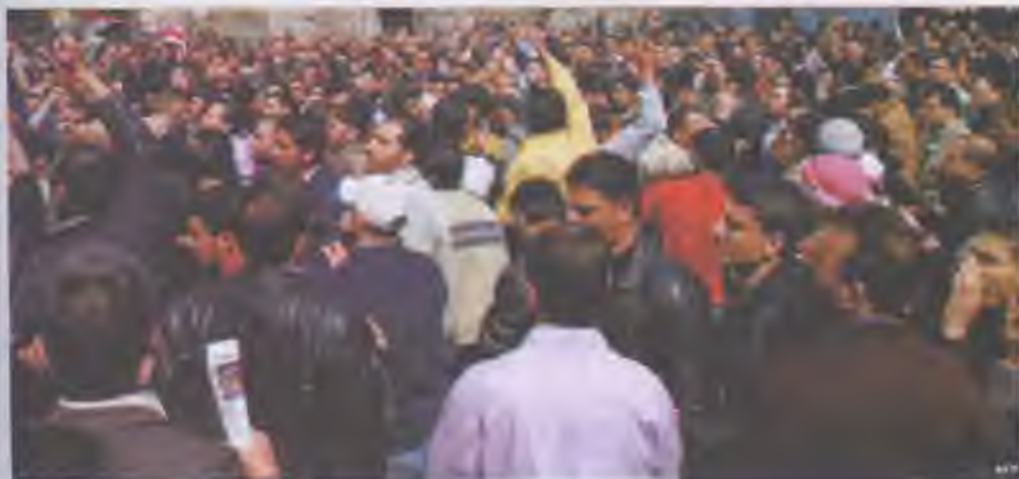
Антиурядова демонстрація в Львів

Термін «бойкот» походить від прізвища Чарльза Канінгема Бойкота, британського управлінця в Ірландії, землі якого відмовились обробляти місцеві жителі. Одним з найвідоміших прикладів використання тактики бойкоту стала відмова населення африканського походження міста Монтомері (штат Алабама, США) від використання міського транспорту в 1955 р. Таким чином мешканці висловили свій протест проти расової сегрегації.