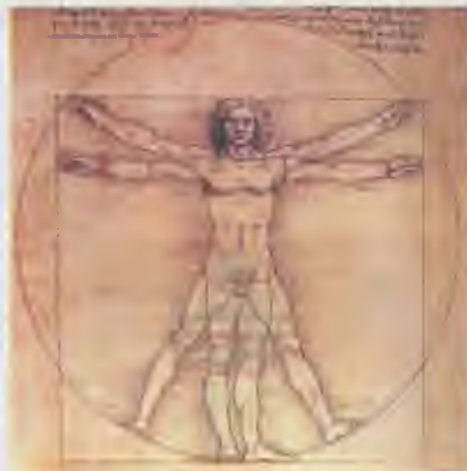
Малюнок Леонардо да Вінчі, що зображує людину з гармонійними пропорціями

Виявом людини як особистості на індивідуальному рівні є соціаль-