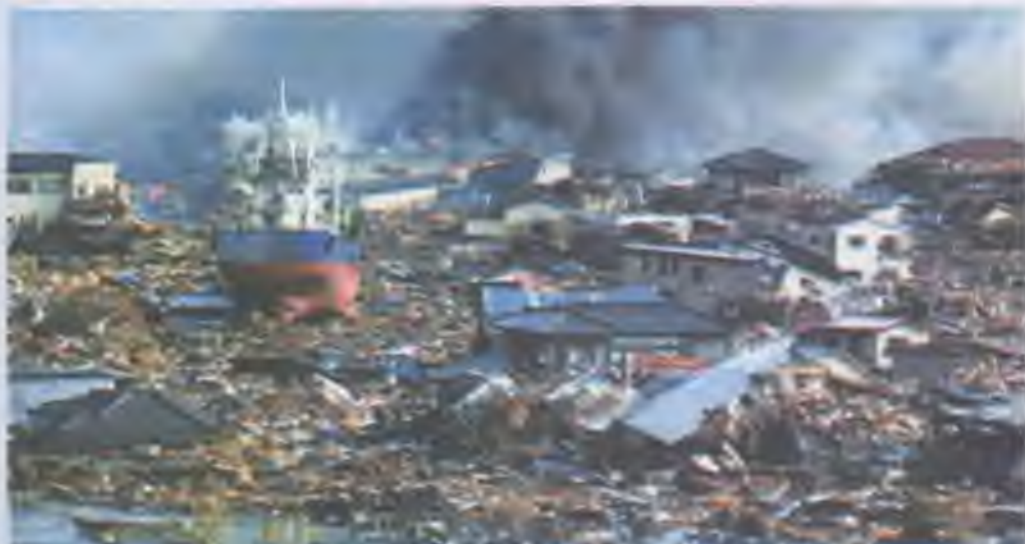
Наслідки землетрусу та цунамі в Японії

Назвіть відомі вам техногенні катастрофи в Україні та світі. Яким чином, на вашу думку, їм можна запобігти?