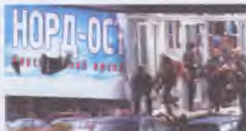
Теракт у Москві

Інший відомий терористичний акт відбувся в Москві 25 жовтня 2002 р., коли чеченські терористи захопили в заручники й утримували три дні приблизно 800 глядачів мюзиклу «Норд-Ост». Під час операції звільнення не вдалося уникнути людських жертв: загинуло понад 100 заручників, серед яких було чотири громадянина України.