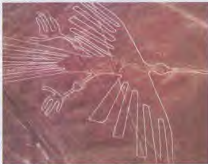
Птах — один із малюнків у пустелі Наска. Довжина малюнка — 250 метрів