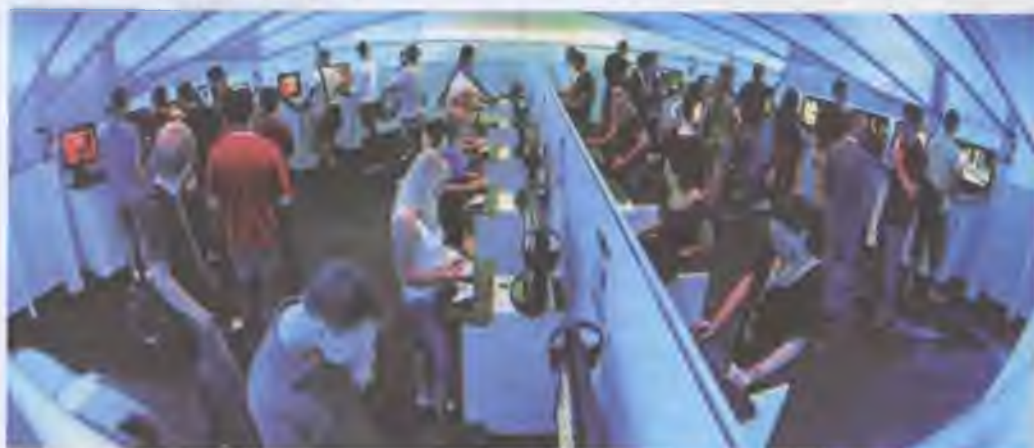
Виставки новинок ігрової індустрії в м. Лейпціг, Німеччина

Перші готи з'явилися на початку 1980-х років на хвилі пост-панку. Панківський епатаж готи спрямували в русло пристрасної до вампірської естетики, темного погляду на світ. Елегантний готичний аристократ — чоловічий образ, що культивується субкультурою готів. Вирізняється стилізація під образ джентльмена вікторіанської епохи з елементами вампіризму і пост-панківської екстравагантності: довге волосся, бліде обличчя, нафарбовані очі. У готів є навіть свої лінії одягу.