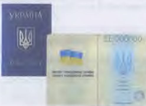
Паспорт громадянина України

Громадянство України підтверджує офіційний документ, яким є паспорт (у військовозобов'язаних ще й військовий квиток або посвідчення особи офіцера), у дітей віком до 16 років — свідоцтво про народження. Громадянином України можна бути від народження, за походженням (якщо дитина народилася за межами України, але батьки — громадяни України), через прийняття громадянства України. Щоб стати громадянином України, іноземній особі потрібно відмовитися від іноземного громадянства, постійно проживати в Україні протягом п'яти років, володіти українською мовою та визнавати й дотримуватися Конституції України.