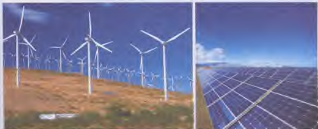
Альтернативні види енергії

використанні й охороні природних ресурсів. Політика України орієнтована на природоохоронну і ресурсозберігаючу технологію та входження в загальноєвропейську і світову систему екологічної безпеки.