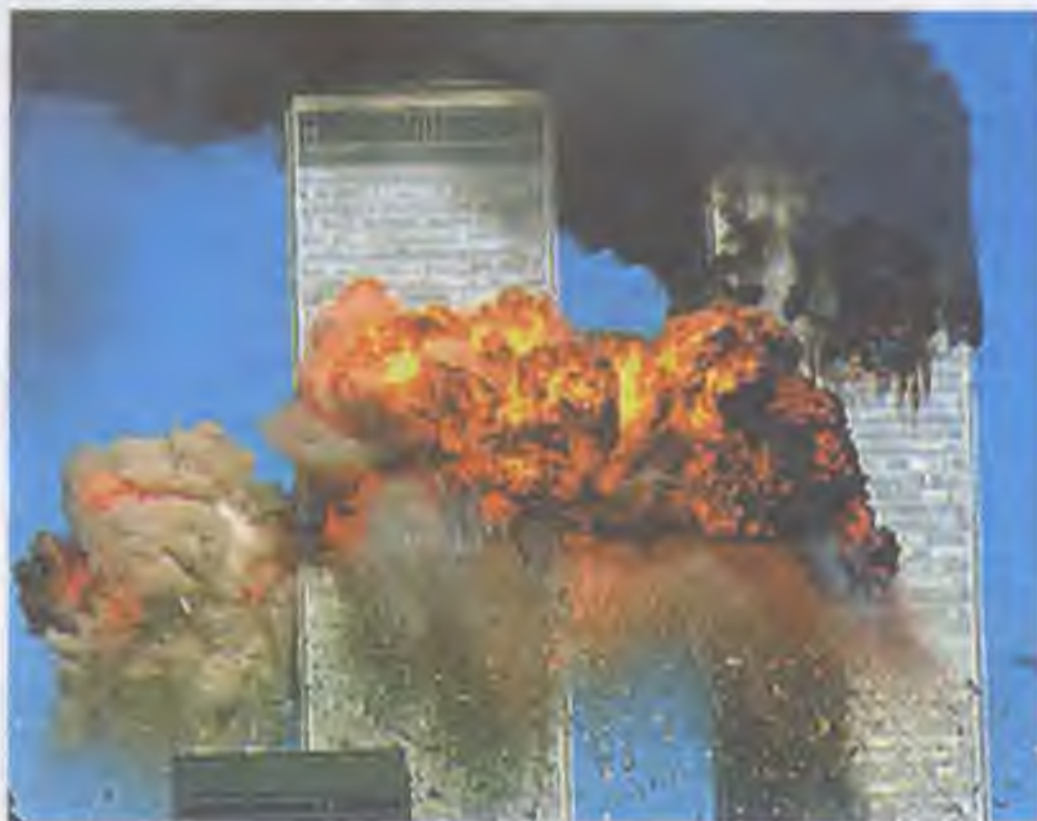
Теракт 11 вересня 2001 р. у Нью-Йорку

Так, під час найвідомішого терористичного акту у світовій історії, який відбувся 11 вересня 2001 р. у Нью-Йорку, терористи-смертники спрямували два літаки із заручниками на борту в будівлі Світового торговельного центру. У результаті загинуло 2750 осіб — громадян понад 90 країн, з двадцятьма українцями включно.