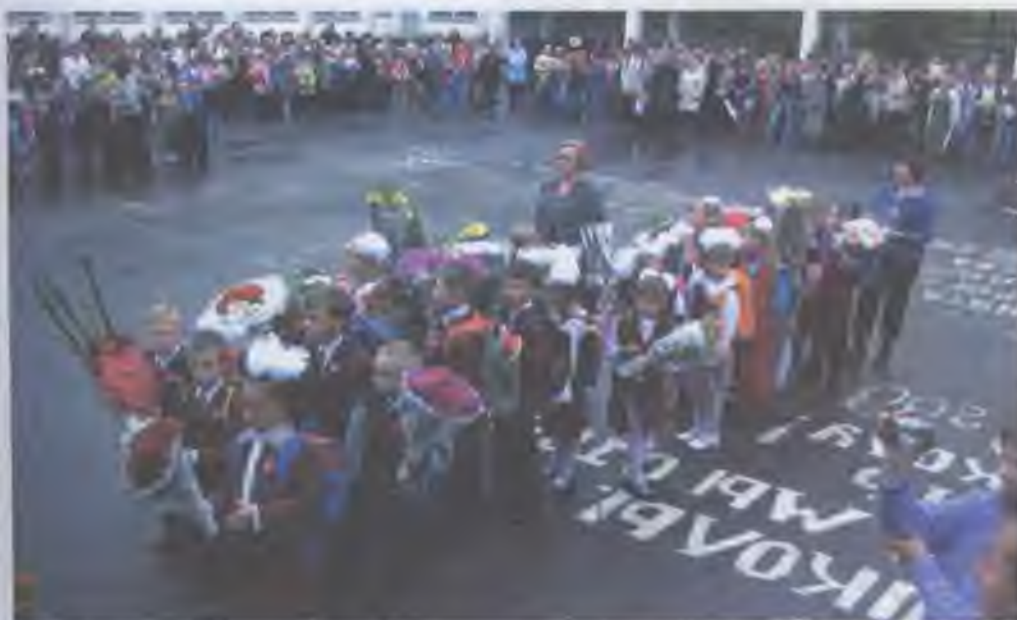
Початок шкільного життя

Центральною ланкою шкільних стосунків є взаємини «учень — учитель». Школа загалом і вчитель зокрема є моделлю тих відносин і процесів, які