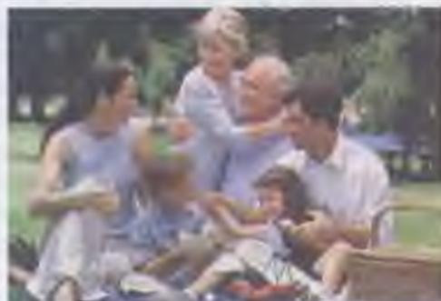
Три покоління сім'ї

Зміна поглядів на виховання дитини та власне цього процесу — і є історичний розвиток людства. У давні часи, на ранніх стадіях розвитку людського суспільства, дитина не являла собою особливої цінності. В суворих умовах тогочасного життя, з високим рівнем народжуваності й дитячої смертності, факт народження дитини та її смерті не брався близько. Сім'єю для дитини тоді були всі люди, які її оточували. Пізніше, в період раннього середньовіччя, дітей зазвичай віддавали на виховання в монастирі, розлучаючи при цьому з рідними на тривалий час. Стала середньовічна сім'я була патріархальною, в ній дитина повністю залежала від волі батьків. І лише в нову епоху дитина виступає в сім'ї як окрема особистість. Враховуються її потреби, бажання та інтереси. Сучасна дитина займає чільне місце в родині, виконуючи функцію управлінця, оскільки всі члени сім'ї працюють над забезпеченням саме її потреб. Турботливе ставлення до дітей у сім'ї, любов — це і є результат історичного розвитку сім'ї як соціального інституту.