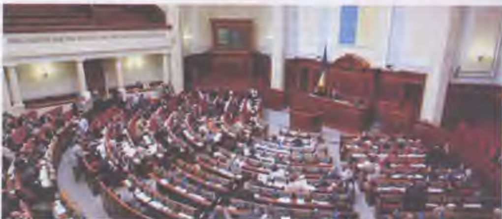
Засідання Верховної Ради України

До повноважень Верховної Ради належать: внесення змін до Конституції України та прийняття законів; призначення всеукраїнського референдуму щодо зміни території України; затвердження Державного бюджету України та контроль за його виконанням; визначення засад внутрішньої і зовнішньої політики; призначення виборів Президента України у строки, передбачені Конституцією; оголошення за поданням Президента України стану війни і укладення миру, схвалення рішення Президента України про використання Збройних Сил України та інших військових формувань у разі збройної агресії проти України; усунення Президента України з поста в порядку особливої процедури (імпичменту); надання згоди на призначення Президентом України Прем'єр-міністра України та здійснення контролю за діяльністю Кабінету Міністрів України. До компетенції Верховної Ради належить призначення на посаду та звільнення вищих посадовців України, в тому числі