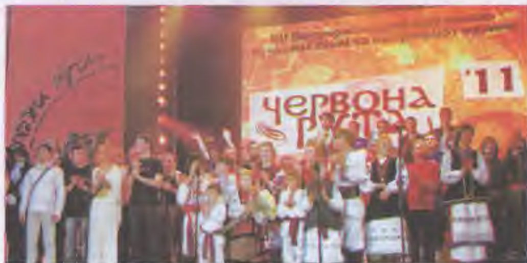
XII Всеукраїнський фестиваль сучасної пісні та популярної музики «Червона рута»

? Які виникли проблеми, коли Україна стала на шлях незалежності? Оцініть допомогу діаспори у становленні нової держави на міжнародній арені.