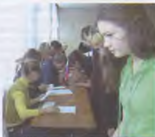
Вибори до шкільної ради

Коли учнівське самоврядування зароджувалося, йому відводилася лише певна роль в організації дозвілля, відпочинку, розваг. Але згодом у змісті його діяльності значне місце займають суспільно корисні справи, спрямовані