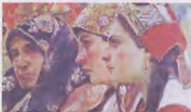
Федір Кричевський. Три покоління

7. Дорослість. Цей період характеризується творчою діяльністю, продуктивною працею, піклуванням про інших, зокрема про своїх дітей, родину. Якщо ці потреби не задовільнити, у людини може виникнути відчуття застою.