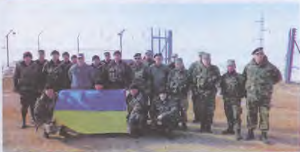
Українські миротворці в Косово

За роки незалежності у міжнародних операціях взяли участь понад 26 тис. військовослужбовців Збройних сил та представників органів внутрішніх справ України. Виходячи із чисельності своїх миротворчих контингентів, Україна входить до складу перших 20–30 країн серед країн-учасниць миротворчості (загальна кількість — понад 80). Українські миротворці виконували миротворчу місію в Сьєрра-Леоне, Анголі, Гватемалі, Боснії та Герцеговині, Косово, Східному Тиморі, Афганістані, Хорватії, Македонії. Ефективною виявилась миротворча місія українців в Іраку. Протягом останніх років Україна надавала свої авіатранспортні послуги для виконання завдань у Демократичній Республіці Конго та Косово.