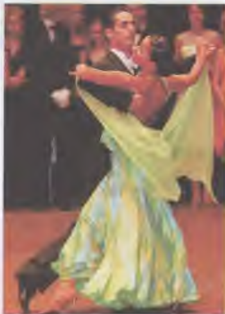
Вальс — субкультура XIX століття

Проте, багато хто вважав вальс аморальним. Поява танцю в Росії не підтрималася офіційними керманичами країни — вальс так і не знайшов шляху до серця ані Єкаторини II, ані Павла I, а особливо до його дружини Марії Федорівни. Зійшовши на престол, Павло I спеціальним указом заборонив танцювати вальс у Росії, і до смерті його дружини двері до царського палацу вальсові були зачинені. Однак на приватних балах після Вітчизняної війни 1812 р. вальс став одним з найулюбленіших танців.