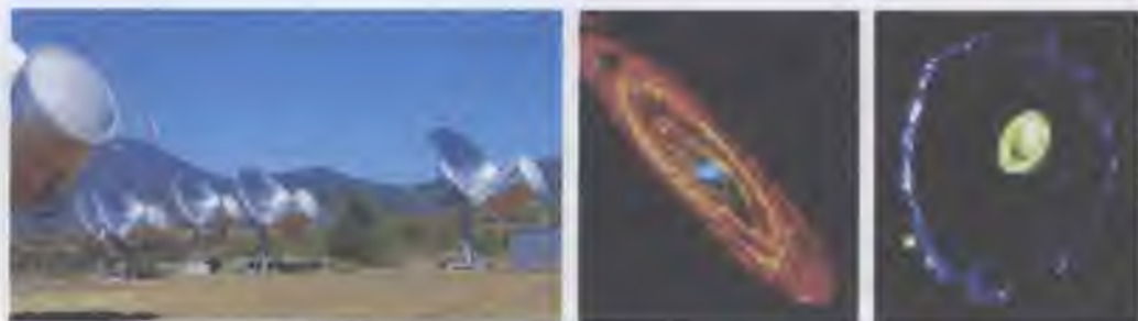
Множинний телескоп Аллена та далекі галактики

7. Яка з теорій походження людини здається вам найдостовірнішою і доказовою? Як ви вважаєте, звідки походить людина?