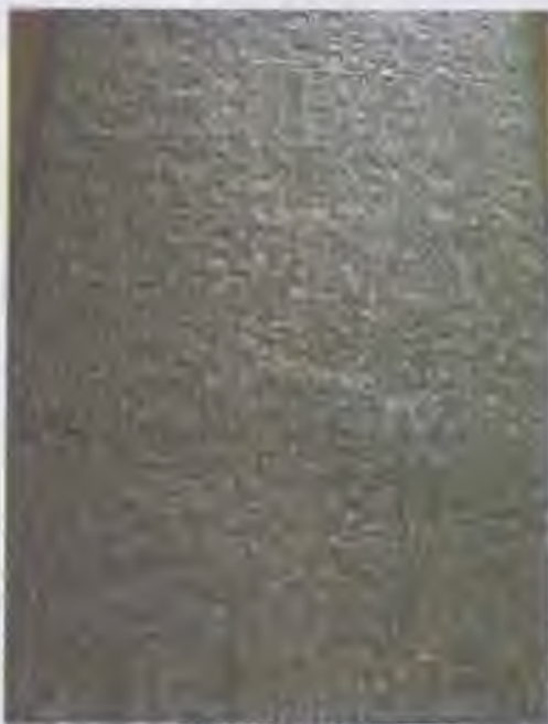
Закони Хамуралі (XVIII ст. до н. е.) — один із найдавніших прикладів поширення інформації

Наступний прорив у розвитку ЗМІ відбувся у XIX ст. із винаходом телеграфу, телефону та радіо. На початку XX ст. розпочали регулярно