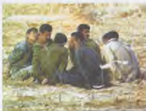
Іракські солдати, взяті у полон під час ірано-іракської війни

Війна , тобто повномасштабний конфлікт між двома чи більше державами, що прагнуть досягти власних політичних цілей за допомогою організованої збройної боротьби. Упродовж 1945–1986 рр. у світі відбулося 250 війн, у яких брало участь приблизно 90 держав, а людські втрати в них перевищили 35 млн осіб. Зокрема, в ірано-іракській війні (1980–1988 рр.) полягло понад мільйон осіб, враховуючи мирне населення. Коли до такого конфлікту залучаються групи держав, що