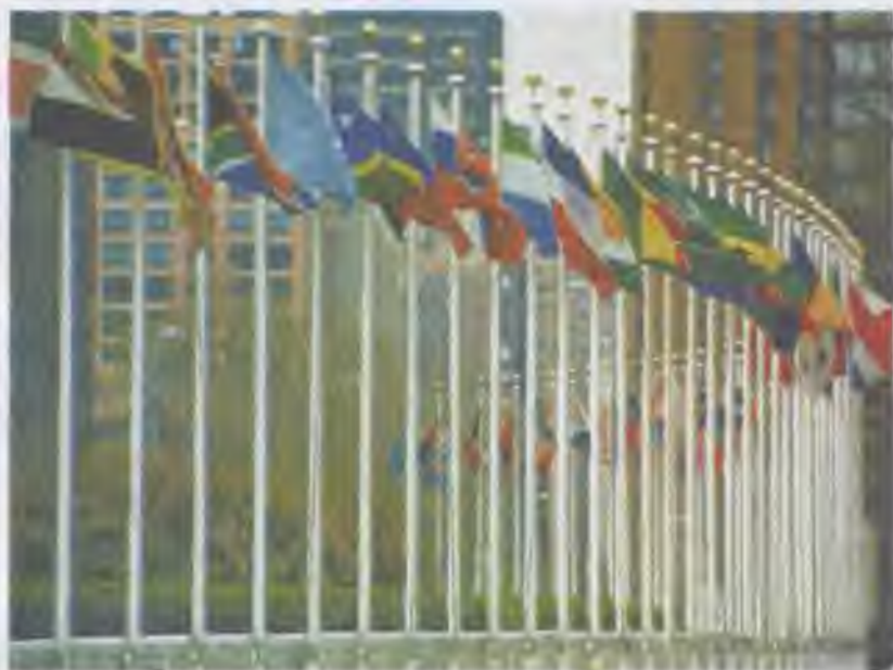
Прапори держав — членів ООН

егоїстичних цілей. Спроби запровадження єдиного міжнародного законодавства у таких випадках виявляються неефективними.