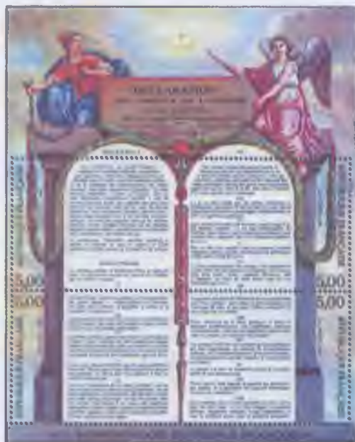
Декларація прав людини і громадянина на поштовій марці

Прочитавши документи, зверніть увагу на час їх прийняття. Як ви вважаєте, чому протягом тривалого періоду на державному та міжнародному рівнях приймаються документи з протидії дискримінації, котрі щоразу підкреслюють їх значущість?