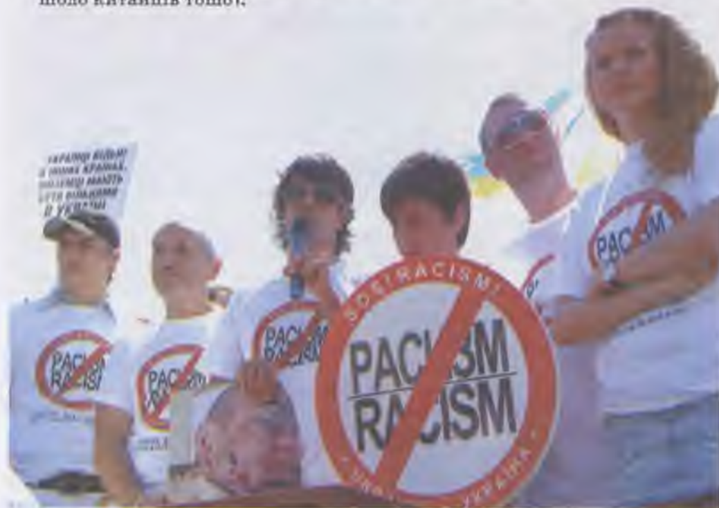
Акція «SOS! Расизм!» у Києві

• расові та етнічні фобії (етнофобії) , що визначають упередження і дискримінацію по відношенню до осіб іншої раси чи етнічної групи (наприклад, білий і чорний расизм, антисемітизм, сінофобія — фобія щодо китайців тощо);